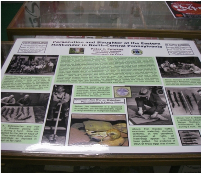
写真1 ヘルペンダー駆除のポスター