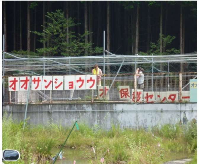
写真10 県立大生の看板取付け作業