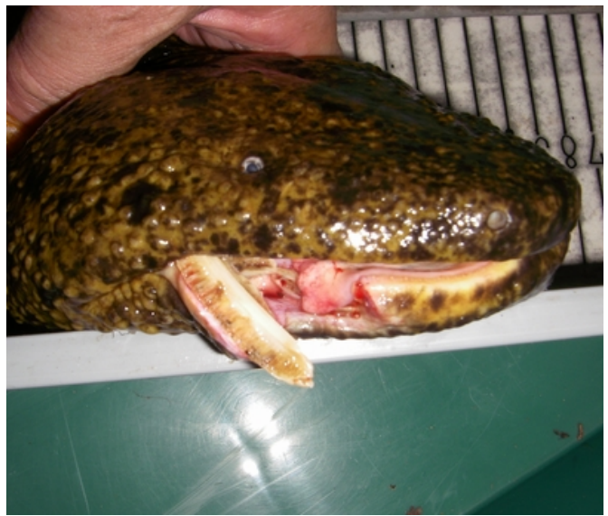
写真4 緊急保護された下顎骨折個体