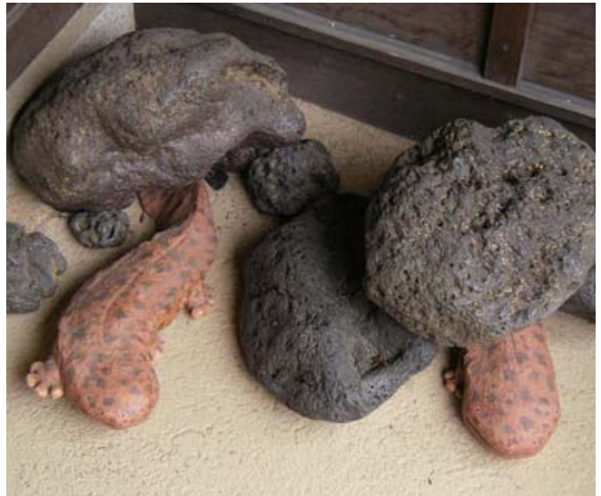
写真8 「井筒屋」入り口の大垣ハンザキ