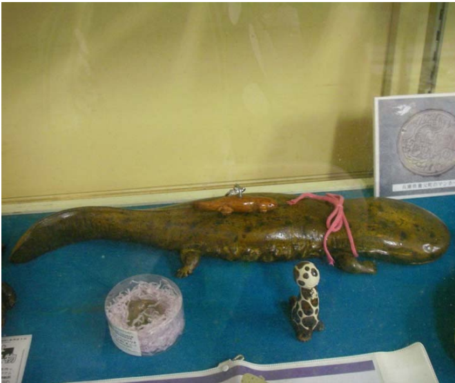
写真7 豊岡土木職員の作品