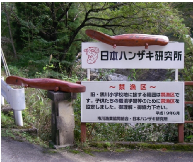
写真9 ハンザキ研入り口の大ハンザキ