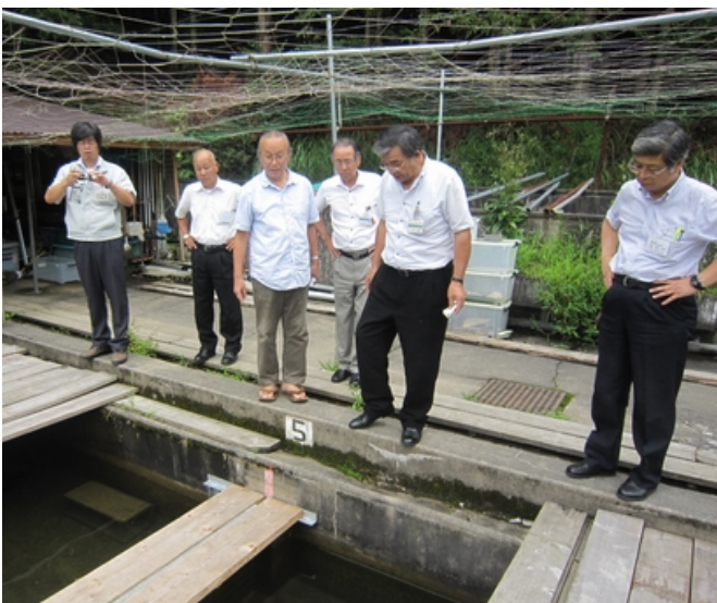
写真11 市長さんの視察