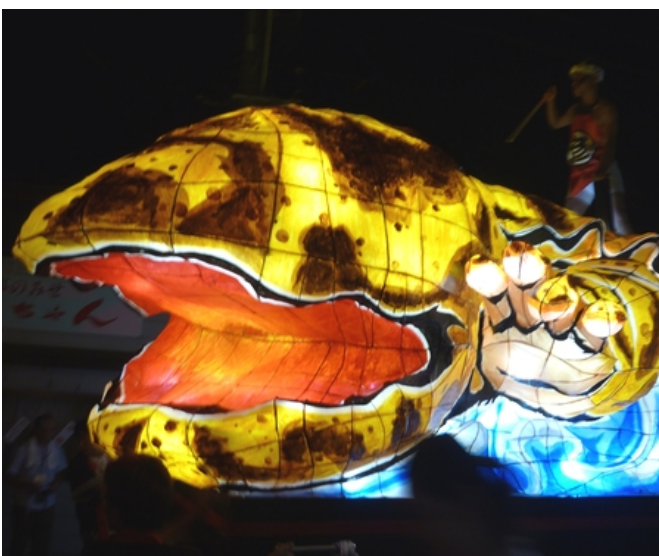
写真5 ハンザキ・ネブタ