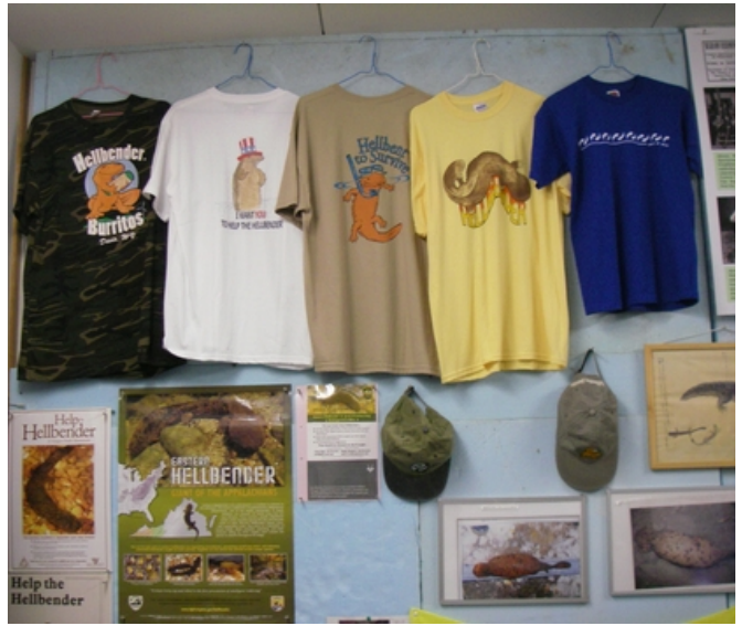
写真2 ヘルペンダーのグッズ類