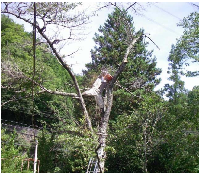
写真3 地域の役員方の草刈、枯れ木の伐採作業