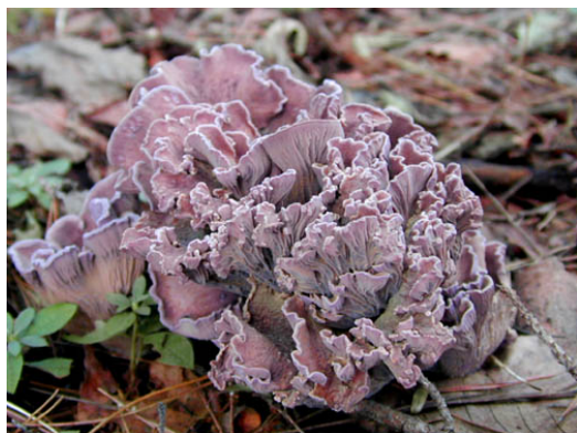
オオムラサキアンズタケ

日本ハンザキ研究所イベント、初夏のトレッキングは【キノコ観察会】です。 キノコといえば秋のイメージですが、実は今の季節に多くの種類が見られるのです。