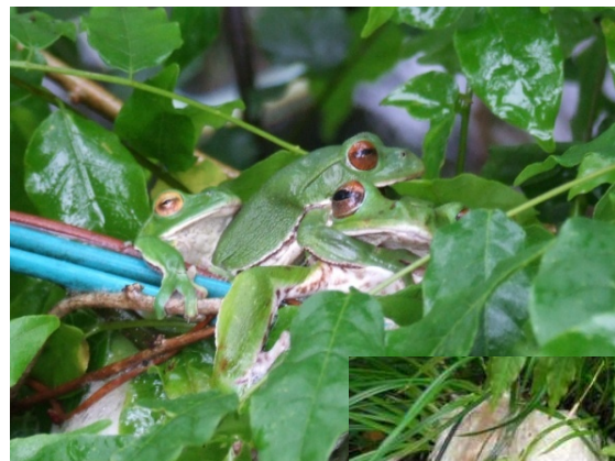
産卵行動中のモリアオガエル

また、当施設では保護飼育中のオオサンショウウオの夜の行動を観察することもできます。