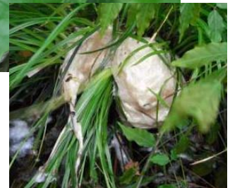
草に生み付けられた卵塊