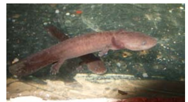
水槽には幼生もいます