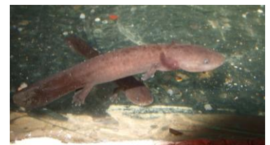
水槽には幼生もいます